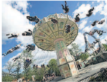
SÄMRE SNURR PÅ AFFÄRERNA.